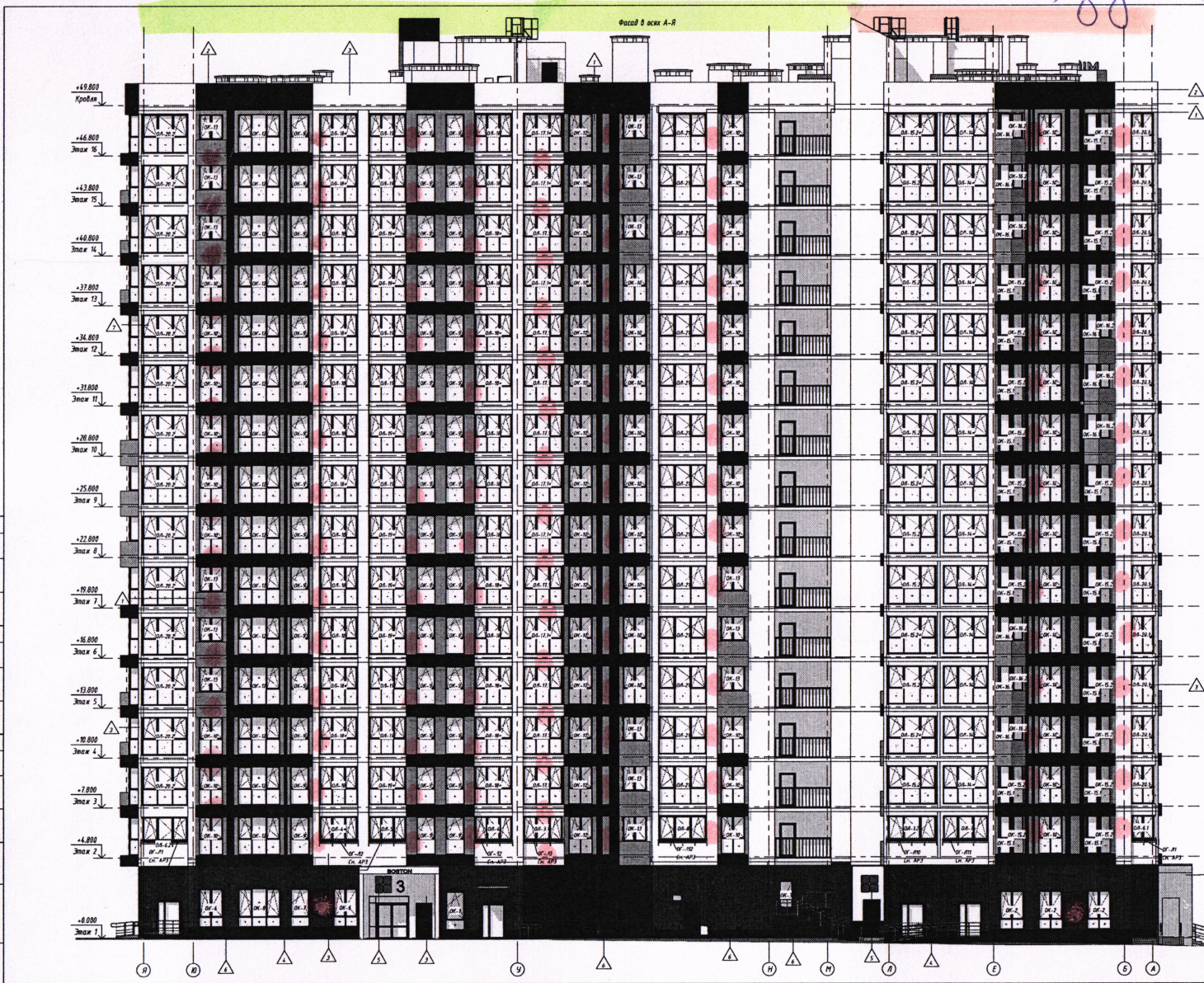
Установка кондиционера в заявленном месте с обязательным устройством отвода конденсата во внутриквартирную систему канализации и закрытием внешнего блока перфорированным экраном в цвет фасада жилого дома