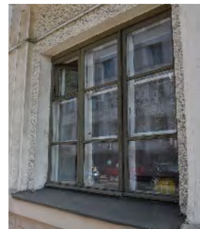
Сохранившиеся аутентичные заполнения оконных и балконных проемов