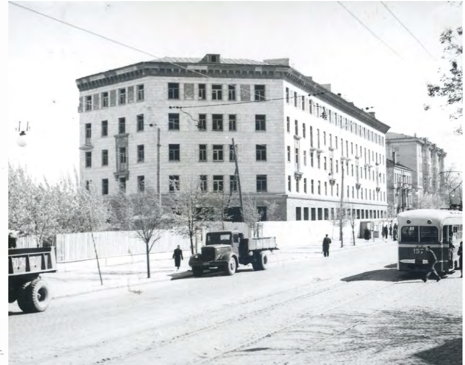
Строительство жилого дома по ул.Московская 9, 1955 - 1956гг.