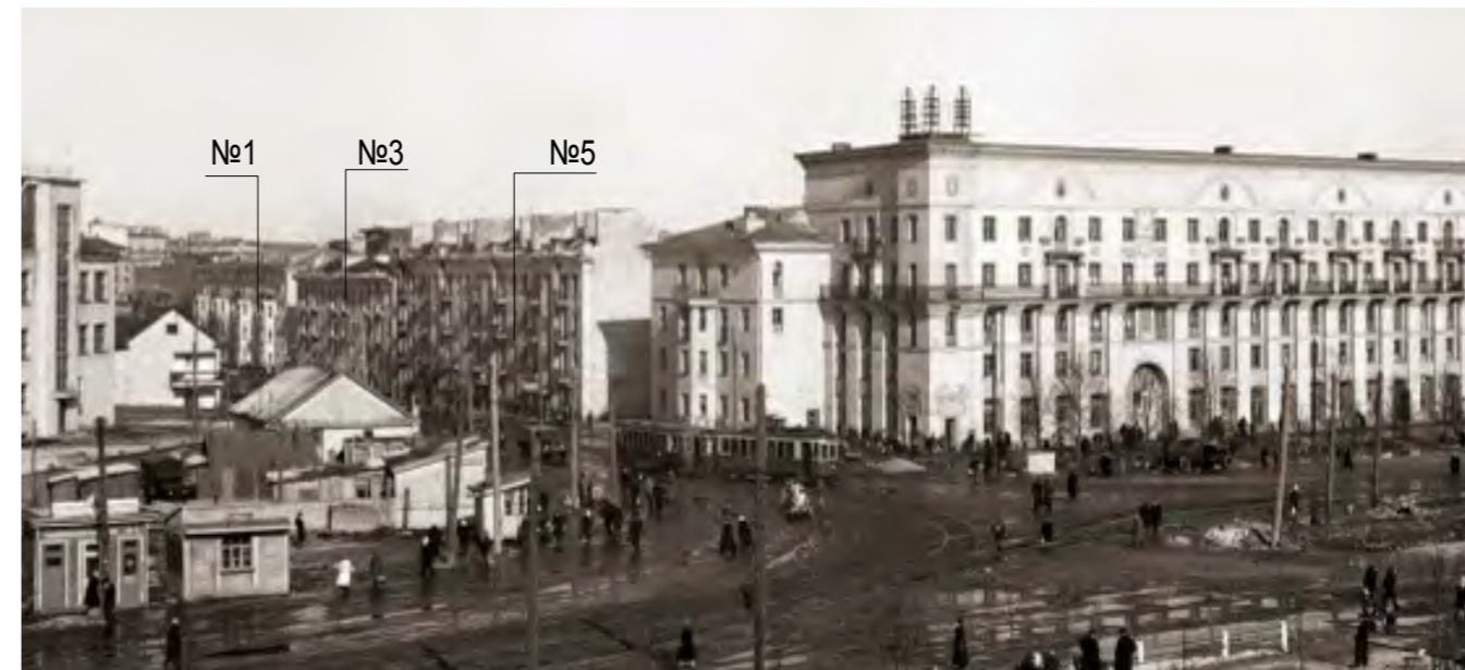
Фото 1956 г.