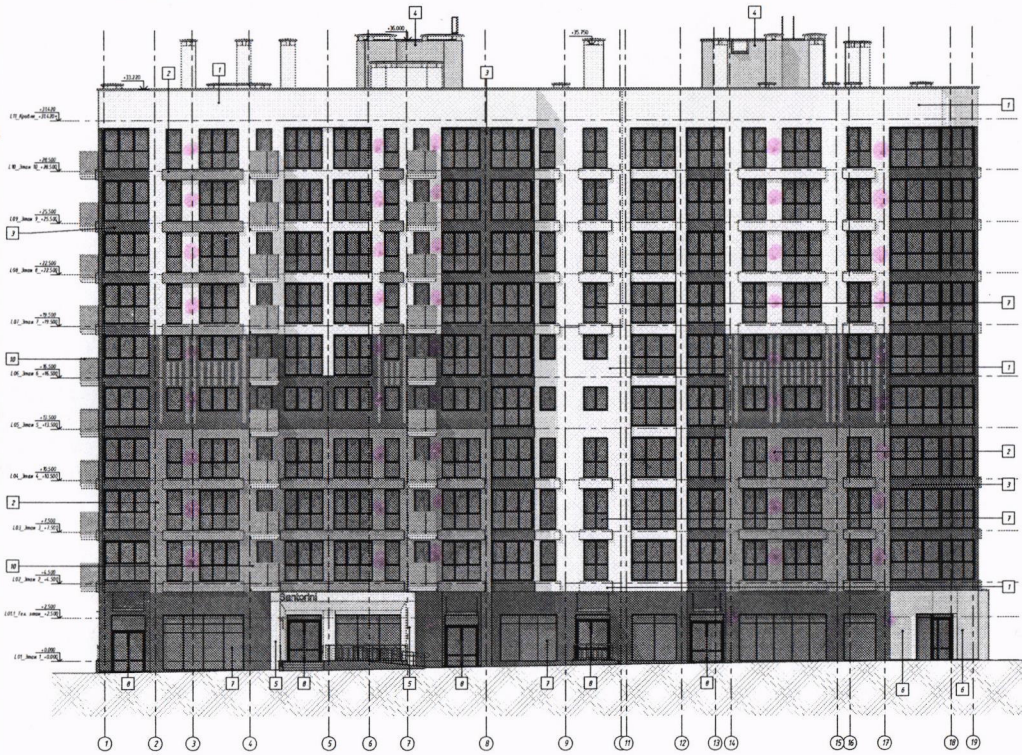
Фасад в осях В-Р