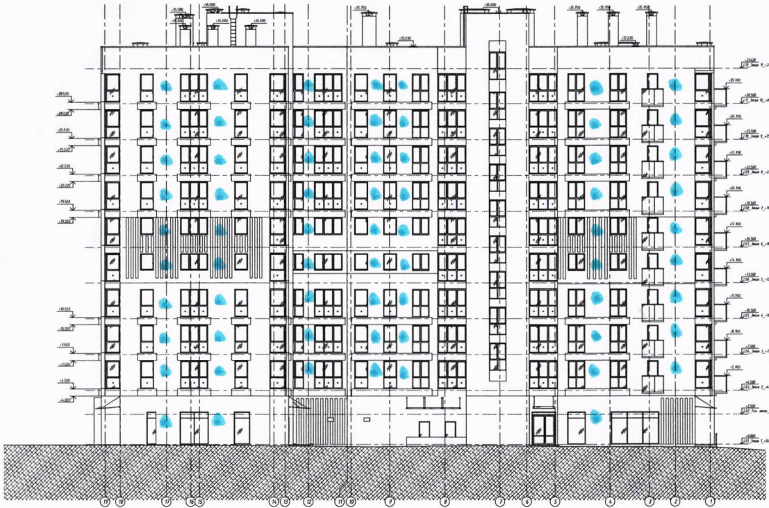
Фасад в осях 19-1