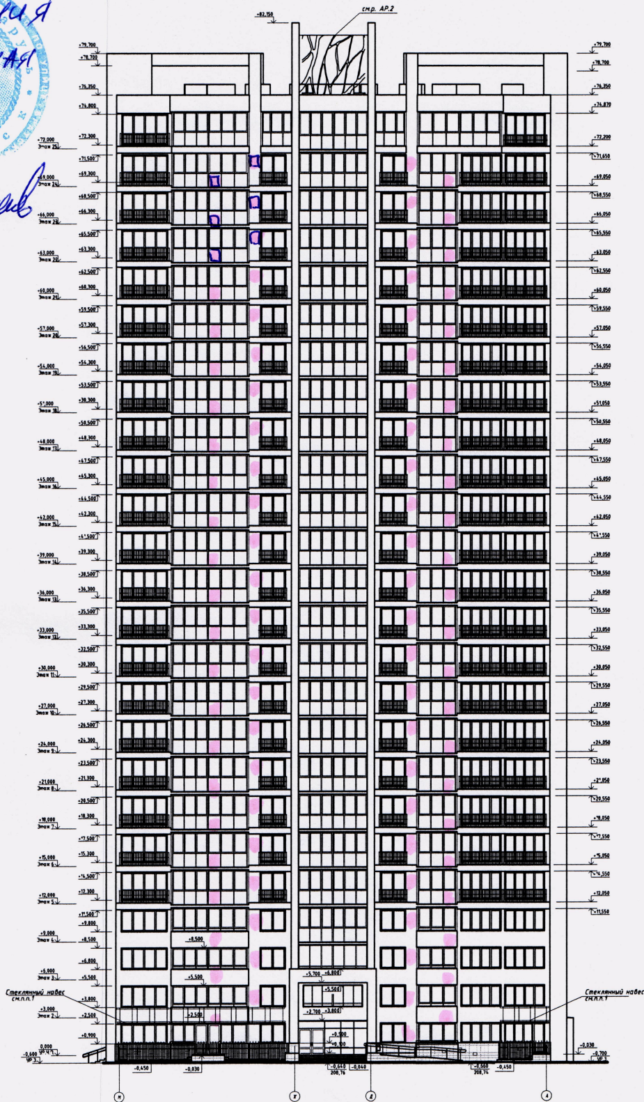
Фасад в осях М-А