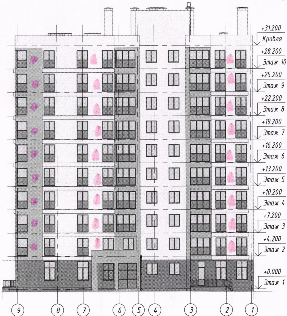
Цветовое решение фасада в осях 9-1 ул. И. Лученка, 19